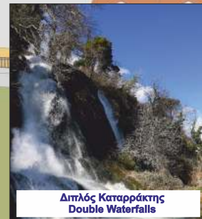
Διπλός Καταρράκτης Double Waterfalls